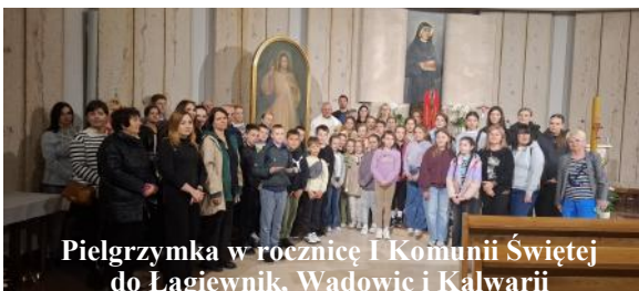
Pielgrzymka w rocznicę I Komunii Świętej do Łagiewnik, Wadowic i Kalwarii

Adoracja Najświętszego Sa- kramentu od poniedziałku do soboty od 7.30 do 17.15.