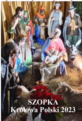
SZOPKA Królowa Polski 2023

SŁOWO PROBOSZCZA Jakie będą w tym roku święta? Nikt z nas nie może zdecydować o pogodzie w ten niezwykły czas, ani o liczbie gości, którzy odwiedzą nas z kolędą. Nie mamy większego wpływu na sytuację w kraju jak i za granicą. Pisząc te słowa mam pełną świadomość, że przecież możemy i powinniśmy się modlić za umiłowaną Ojczyznę, za sprawujących władzę, o pokój na świecie. Rzeczywiście - jako ludziom wierzącym nie wolno nam Pana Boga wykluczać z historii, a raczej trzeba się bardzo starać by Bóg rzeczywiście był dla nas Panem czasów, Alfą i Omega. Wracając jednak do pierwszej myśli - Siostry i Bracia - zróbmy wszystko, by w naszych rodzinach zapanował prawdziwy pokój, by w naszych domach była miła, serdeczna atmosfera. Nie prowokujmy rozmów o polityce i tym wszystkim