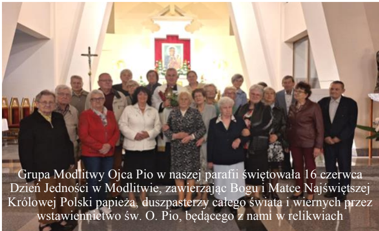
Grupa Modlitwy Ojca Pio w naszej parafii świętowała 16 czerwca Dzień Jedności w Modlitwie, zawierając Bogu i Matce Najświętszej Królowej Polski papieża, duszpasterzy całego świata i wiernych przez wstawiennictwo św. O. Pio, będącego z nami w relikwiach