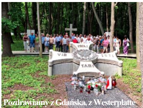
Pozdrawiamy z Gdańska, z Westerplatte

Adoracja Najświętszego Sakramentu w naszej kaplicy na plebani codziennie od 7.30 do 17.15.