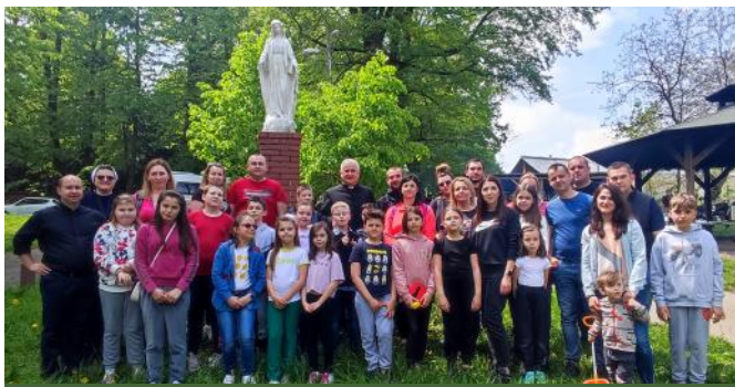
Bardzo dziękujemy Rodzicom i Dzieciom Komuniijnym za Pielgrzymkę do Matki Bożej Kalwaryjskiej (20.05.2023)