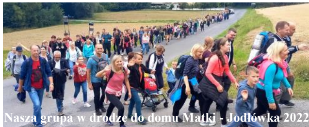
Nasza grupa w drodze do domu Matki - Jodłówka 2022

SŁOWO PROBOSZCZA Mamy co najmniej kilka propozycji. Może zacznę od tej, która byłaby powrotem do parafialnej tradycji. Nieraz słyszałem o pieszej pielgrzymce do Matki Bożej Chłopickiej. Niestety ten piękny zwyczaj został tak jakby wyparty przez Pielgrzymkę do Sanktuarium w Jodłowce. Zrozumiałe, że w tym wielkim wydarzeniu uczestniczą wszystkie jarosławskie parafie i nie może być tak, że brakuje Królowej Polski. W tym roku podejmujemy decyzję i wszystkich serdecznie zapraszamy na Parafialną wędrowkę z Jarosławia, z ul. 3-go Maja 12 do sanktuarium w Chłopicach, którą planujemy na dzień 8 października.