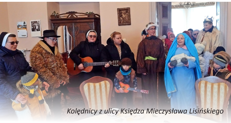
Kolędnicy z ulicy Księdza Mieczysława Lisińskiego

Dziś Mszą św. o godzinie 16.00 rozpocznie się koncert kolęd w wykonaniu naszego chóru i chórów zaprzyjaźnionych z Tywni i Muniny. Po koncercie będzie można złożyć datek na zakup organów do akompaniamentu.